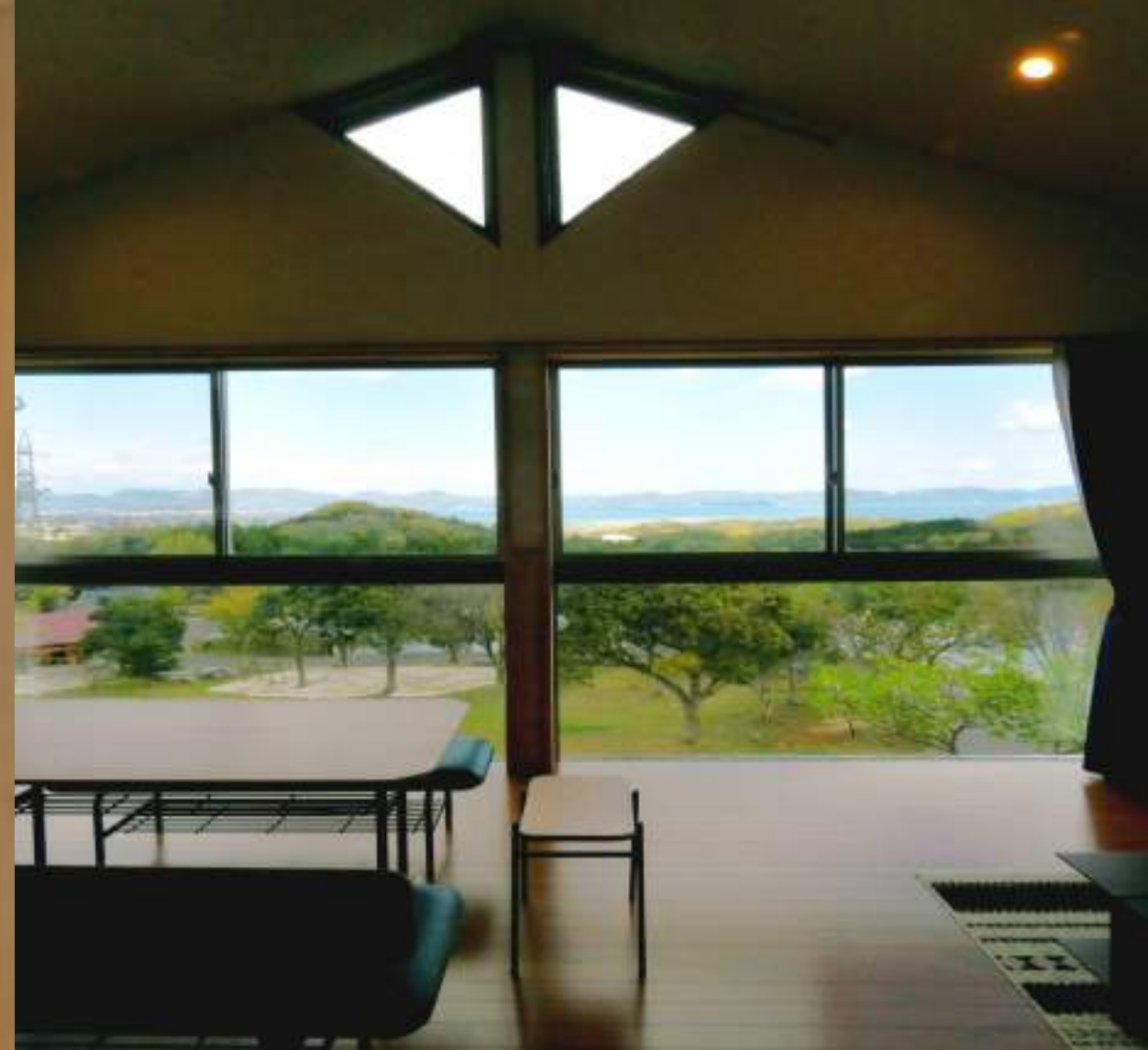
レイクビューコテージ