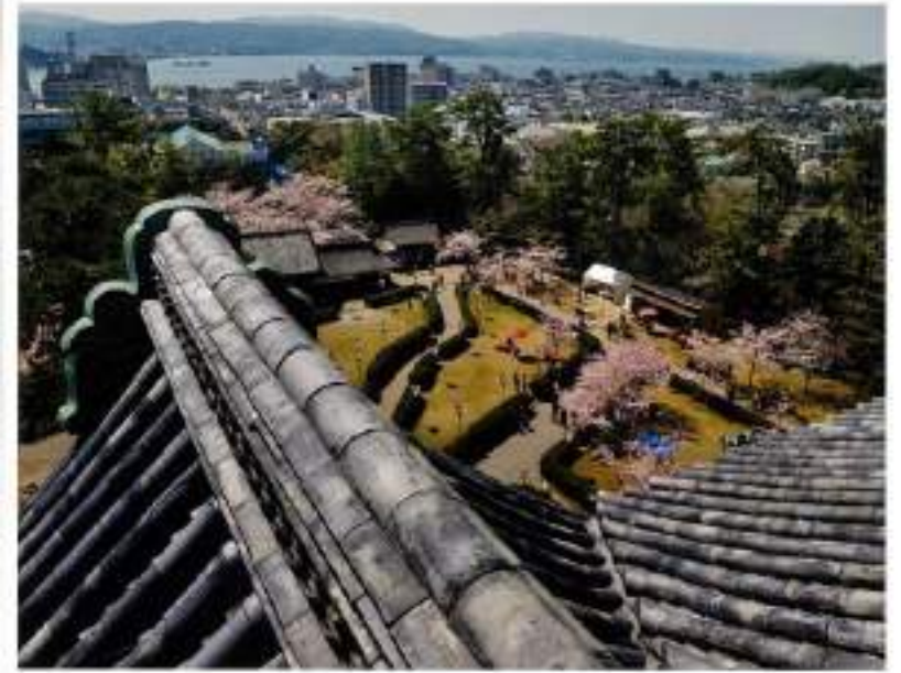
天守最上階からの展望