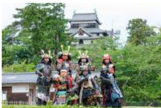
時代案内人イメージ