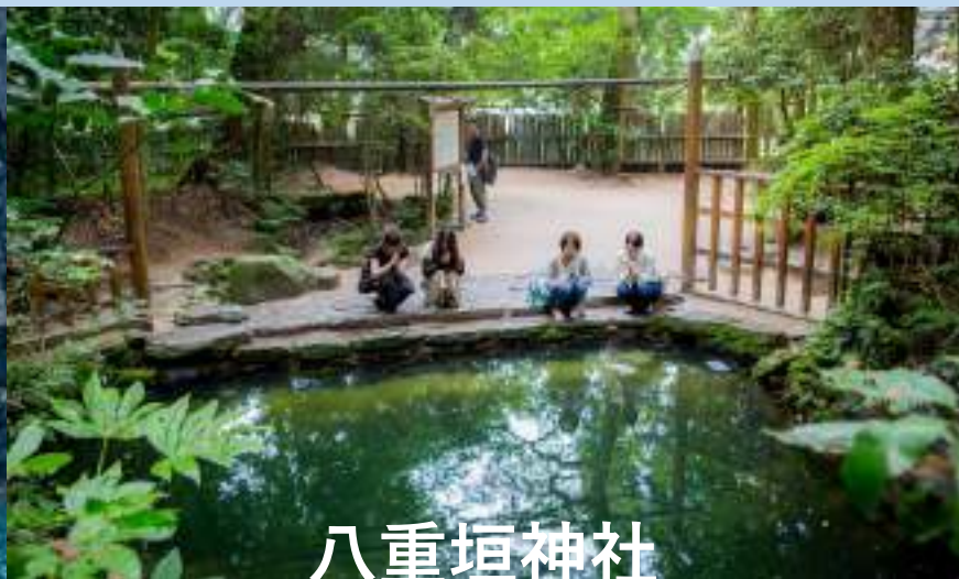
八重垣神社 鏡の池