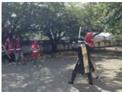
衣装着用甲冑イメージ