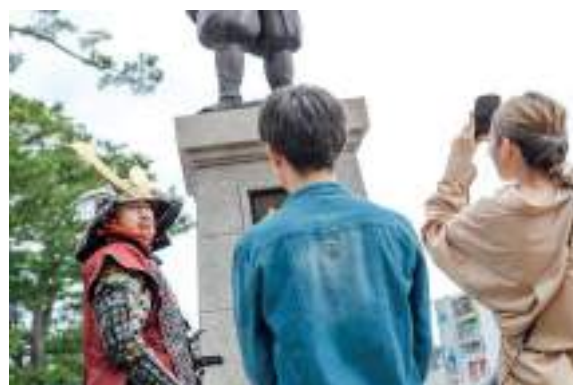
時代案内人イメージ