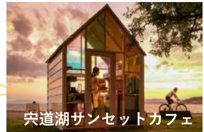
宍道湖サンセットカフェ