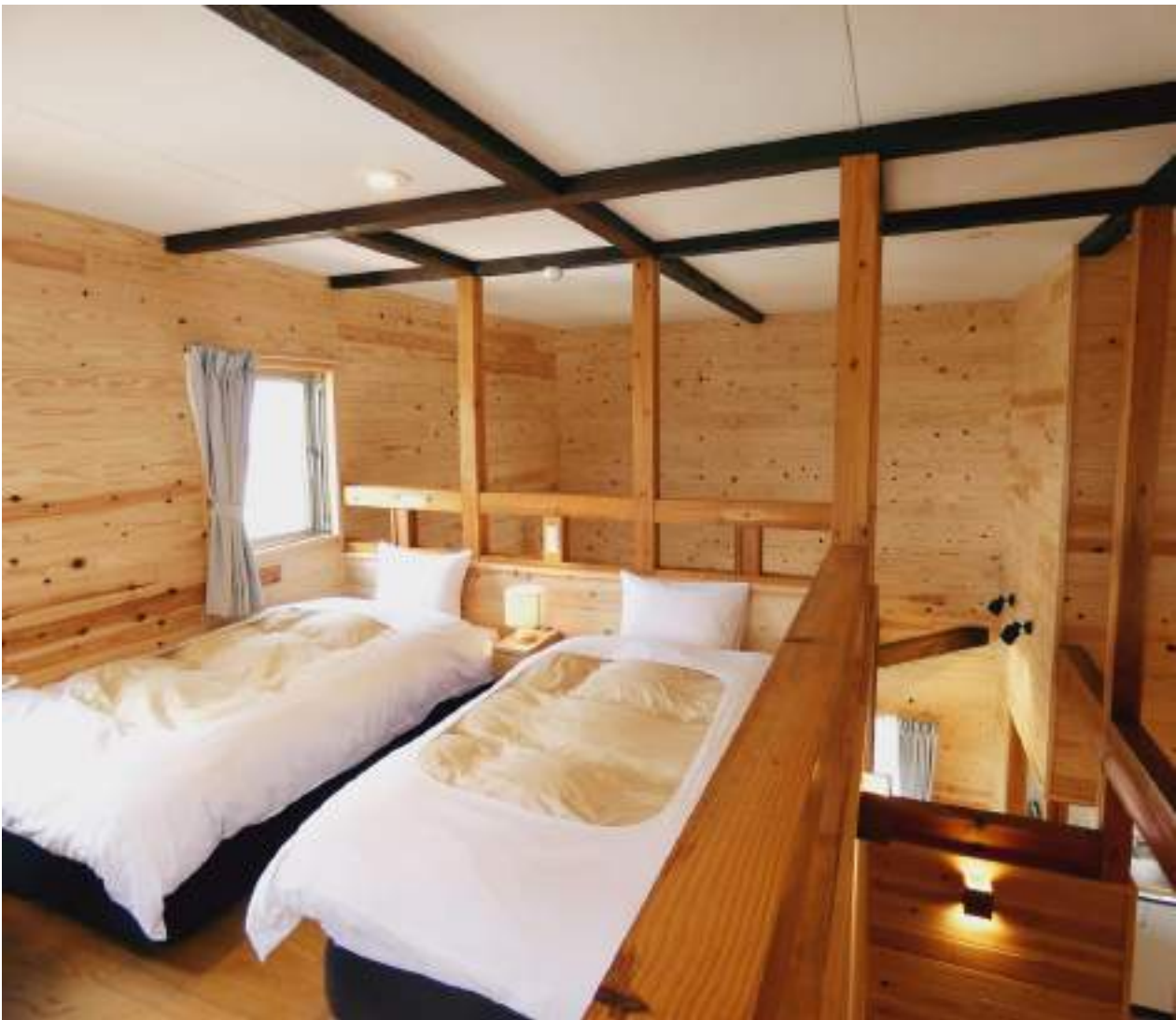
マウンテンコテージ