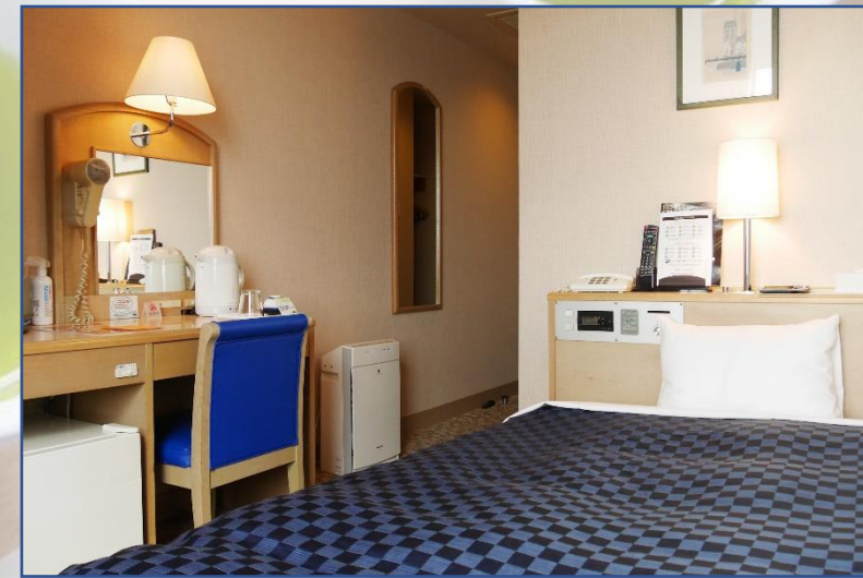
宍道湖ビュー シングルルーム