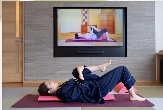
美肌・美活ストレッチ (地元インストラクターとのコラボ)