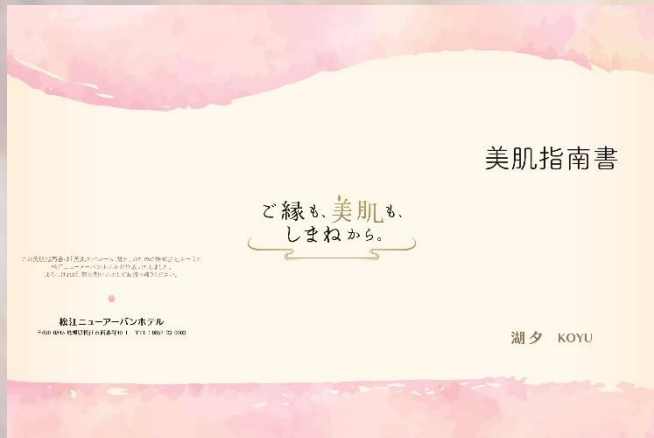
美肌指南書 (POLAとのコラボ)