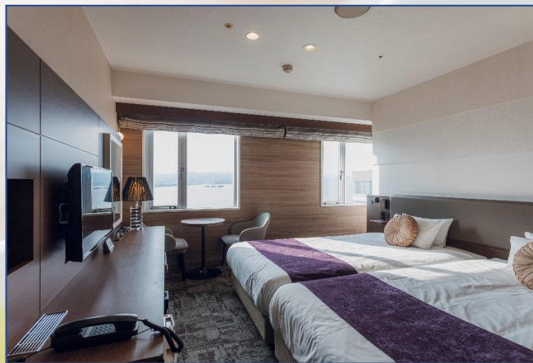
宍道湖ビュー ツインルーム