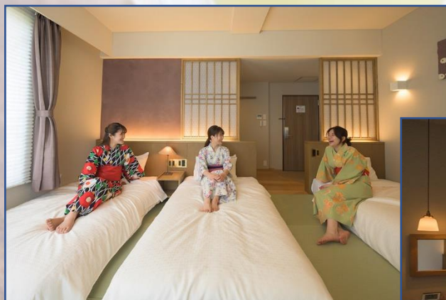
和室ベッドタイプ (6畳)