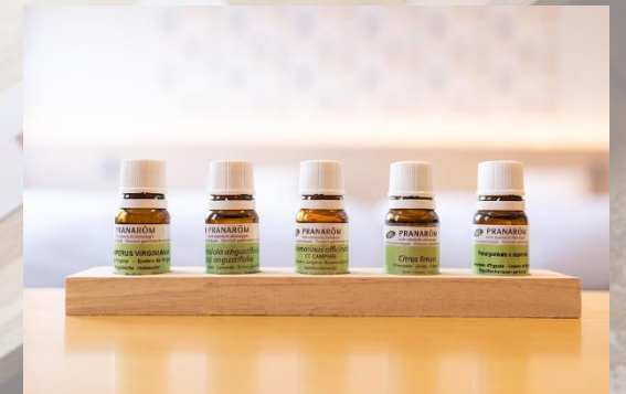
アロマオイル (プラナロム社)