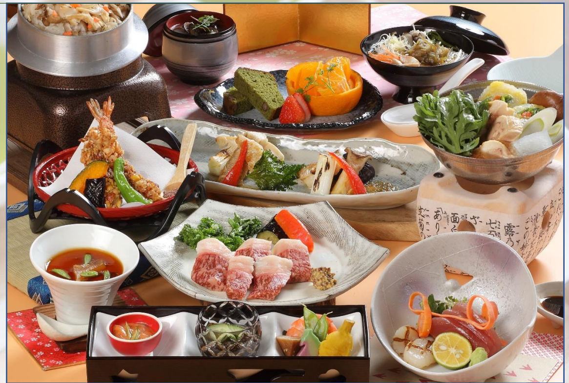
美肌会席 日本海の海の幸と美肌食材を使用