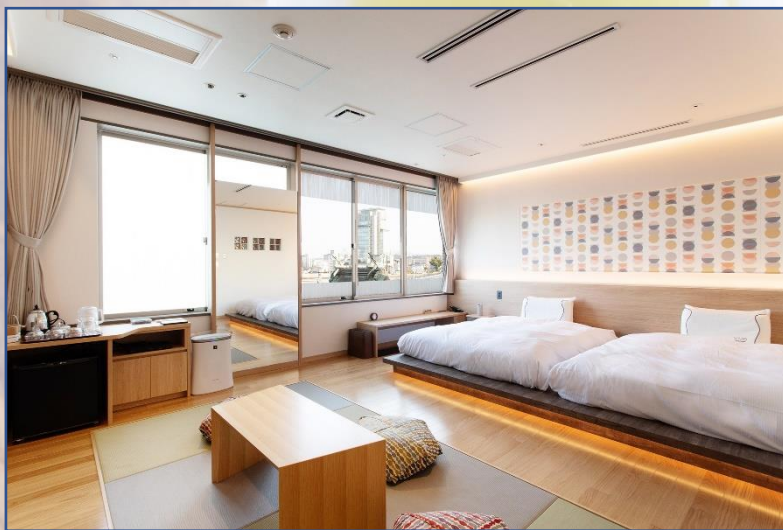
美肌スパルーム 湖夕