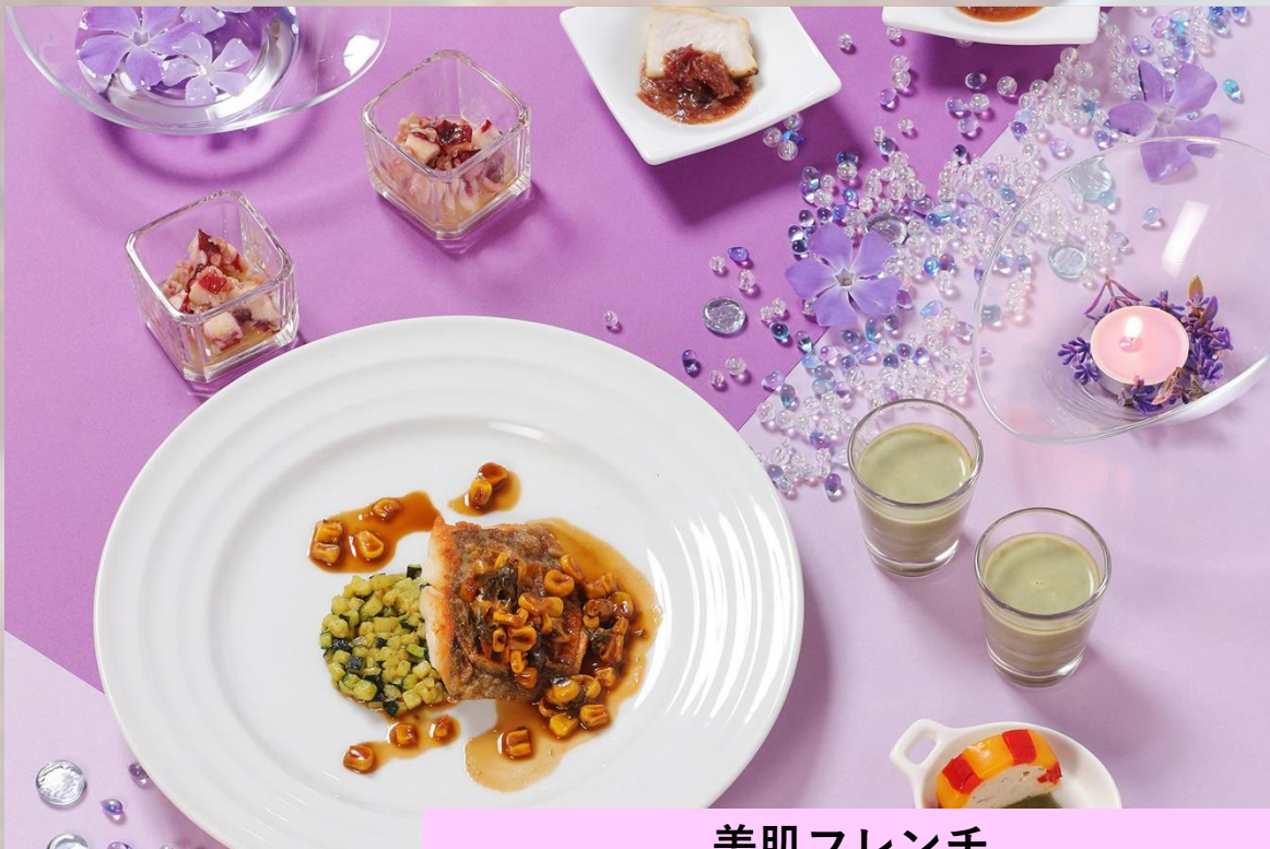
美肌フレンチ 季節のディナービュッフェとコースの 特別仕立て