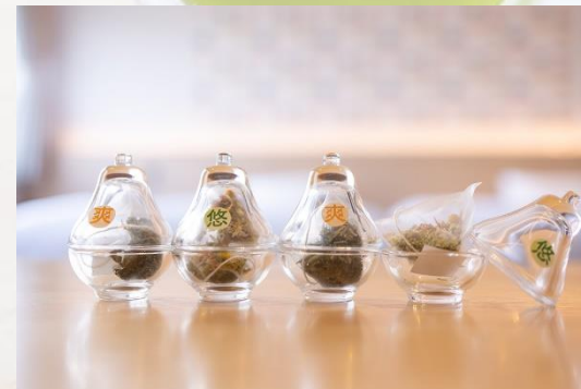
石見の無農薬ハーブティー