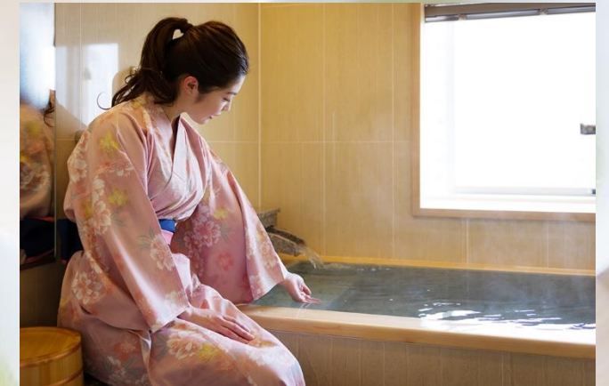
松江しんじ湖温泉 内風呂