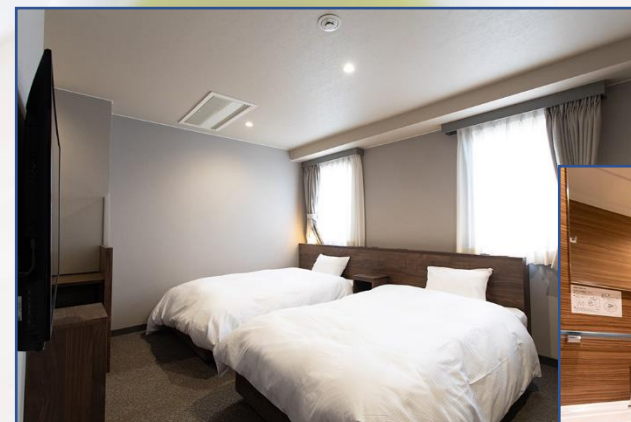
リニューアルツイン