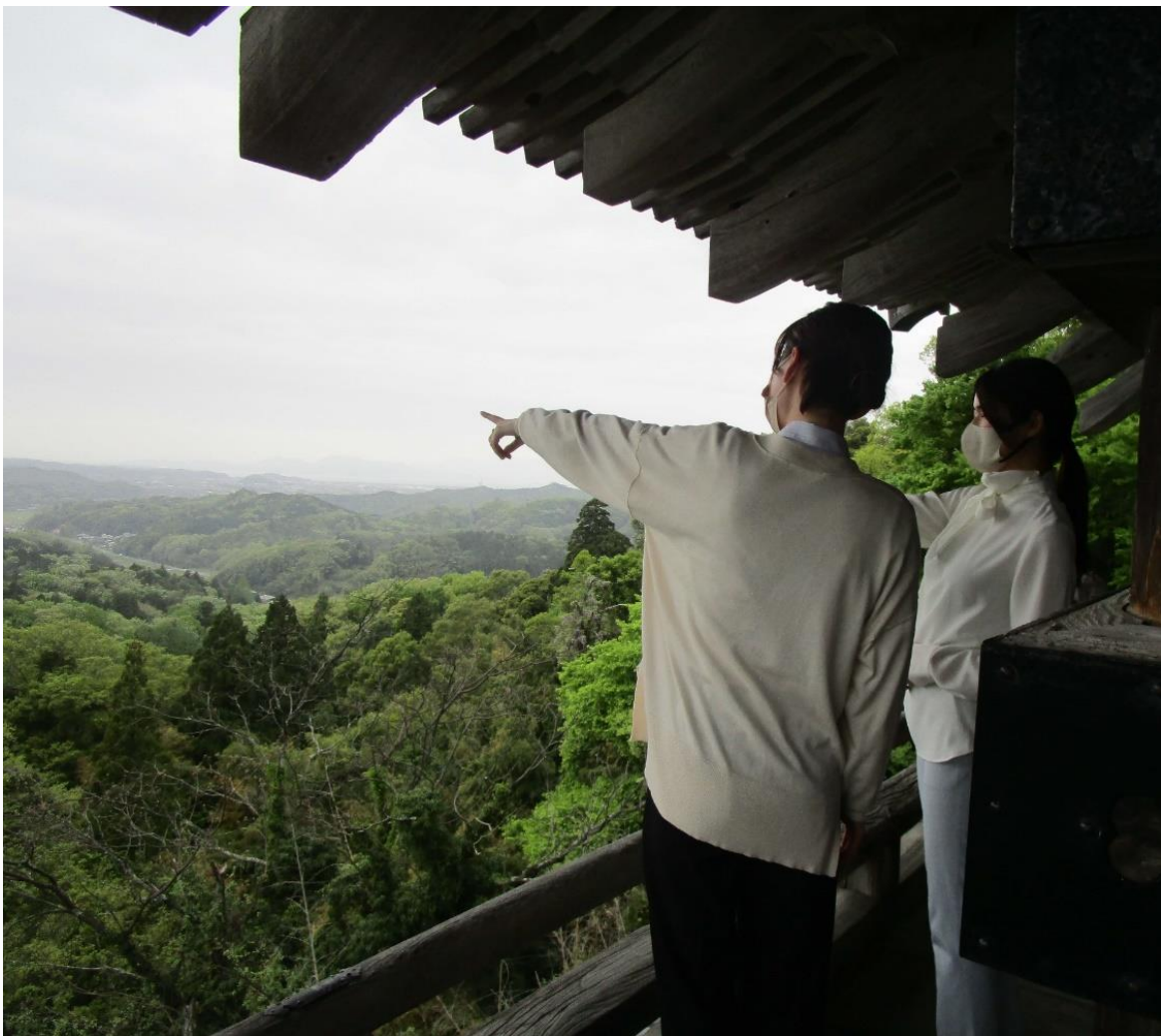
最上部からの眺め