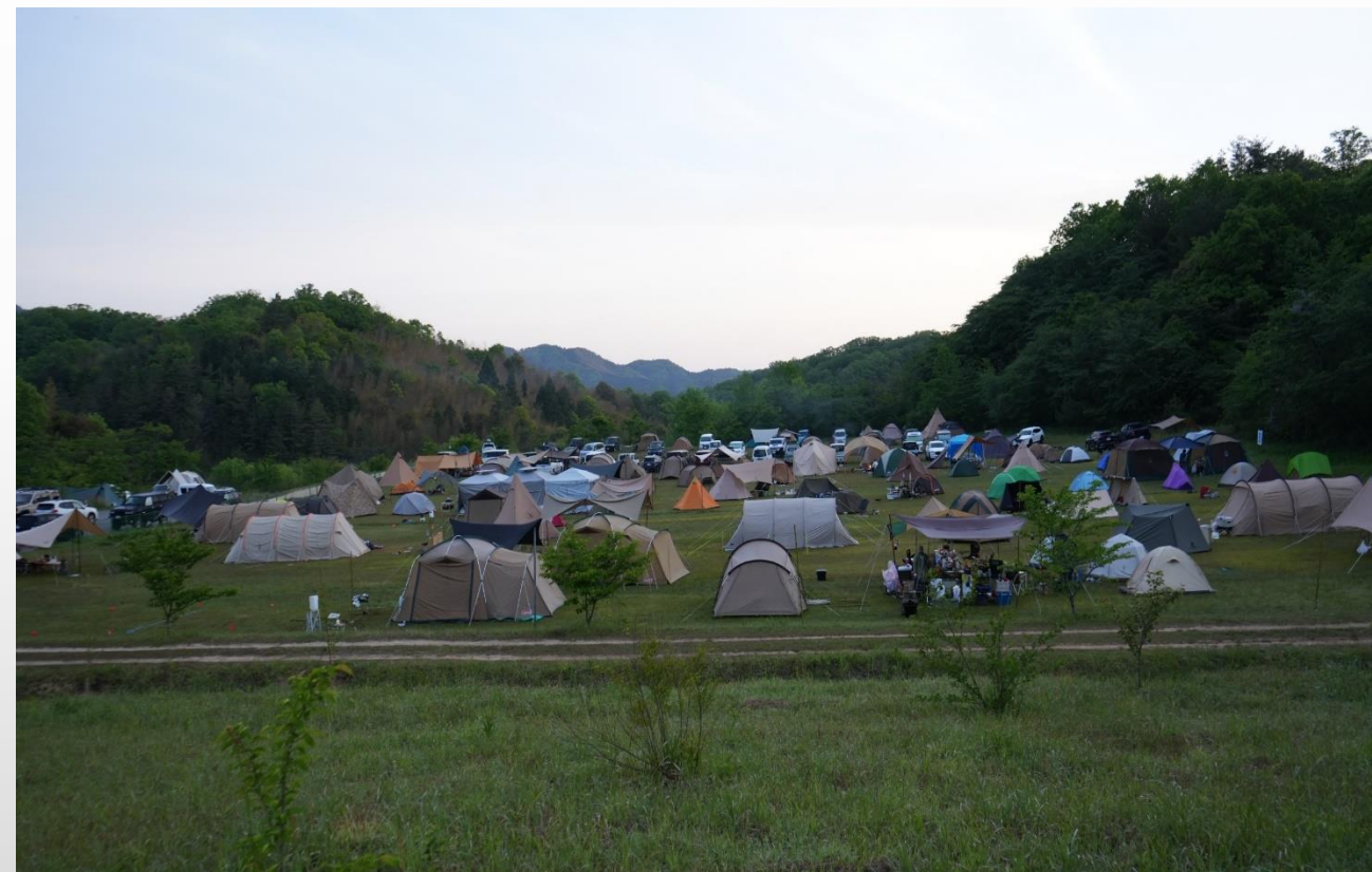
山佐ダムキャンプ場