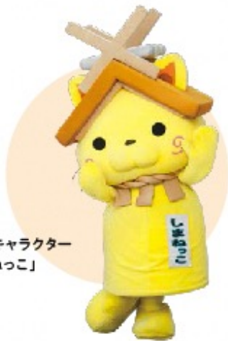
鳥取県観光キャラクター 「しまねっこ」