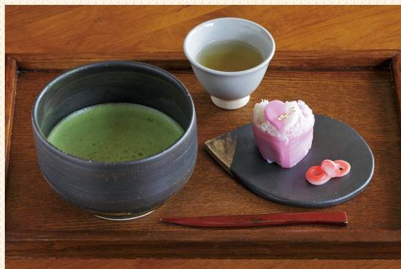
喫茶きはる（松江市）