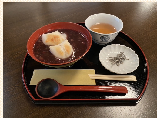
ポナム・ベエル（出雲市）