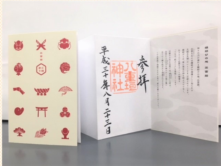
赤表紙（裏面白）パターン 青表紙（裏面黄）パターン