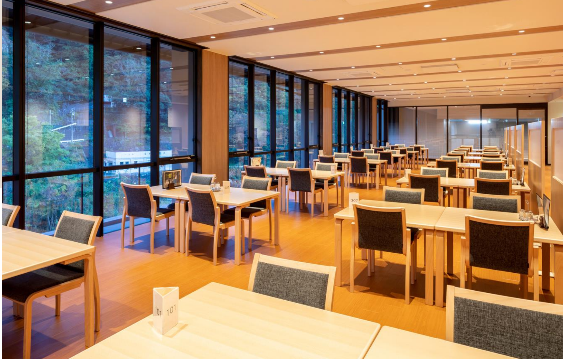
レストラン「稲田姫」