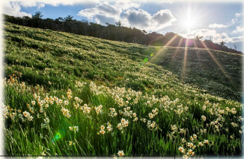
唐音（からおと） 水仙公園