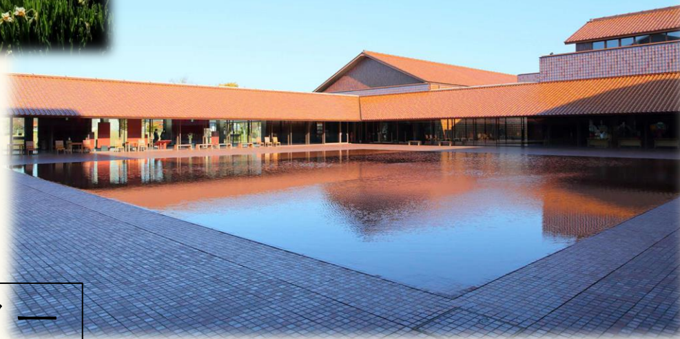
島根県芸術文化センター （グラントワ）