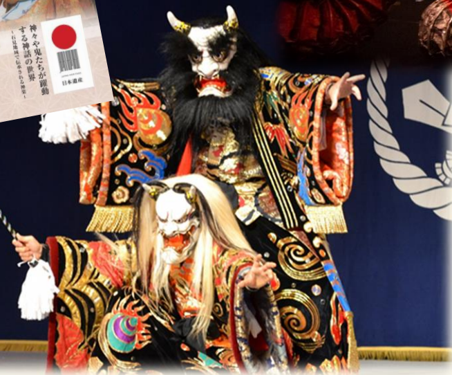
俳優「鈴木拓樹」とのコラボ企画