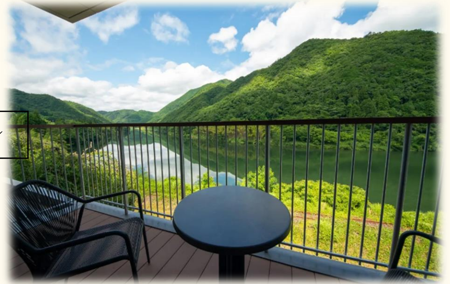
石見ワイナリーホテル